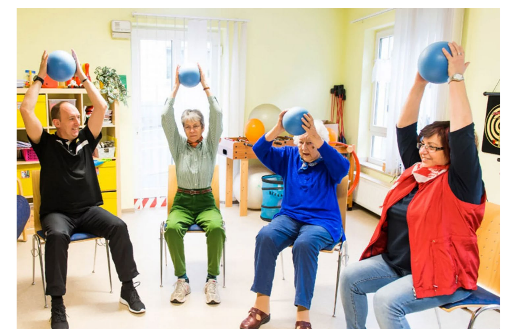
Abb. 3: Hockergymnastik im Mehrzweckraum

Langfristig muss es das Ziel sein, die Lebenswelten von älteren Menschen mit Pflegebedarf mit Impulsen zur regelmäßigen Aktivität zu besetzen und ‚Ermöglichungsstrukturen‘ zu schaffen. Dies gelingt umso besser, wenn die darin handelnden Akteure, z.B. Pflege- und Betreuungskräfte, schon in ihrer Ausbildung sowie in ihrem beruflichen Alltag (BGM) in ihrer Gesundheitskompetenz gestärkt werden und diese auch niederschwellig an ihre Kund*innen weitergeben können. Für Sportvereinsübungsleitungen empfehlen sich vorbereitend Lizenzausbildungen für den ‚Sport der Älteren‘ oder den Rehabilitationssport. Gemeinsame Gestaltungsprozesse der Gesundheitsförderung können in den Pflege-/Betreuungssettings erarbeitet und durch Bewegungsexpert*innen (aus Sportvereinen) sinnvoll ergänzt werden. In der Konstruktion neuer Bewegungsangebote sollten die Besonderheiten der jeweiligen Standorte herausgearbeitet und genutzt werden. Während ländliche Regionen beispielsweise von langjährigen Netzwerken und ‚kurzen Wegen‘ profitieren, überzeugen städtische Regionen oftmals durch eine Angebotsvielfalt und -nähe. Die Bedarfe der Zielgruppe sind dabei stets zu berücksichtigen.