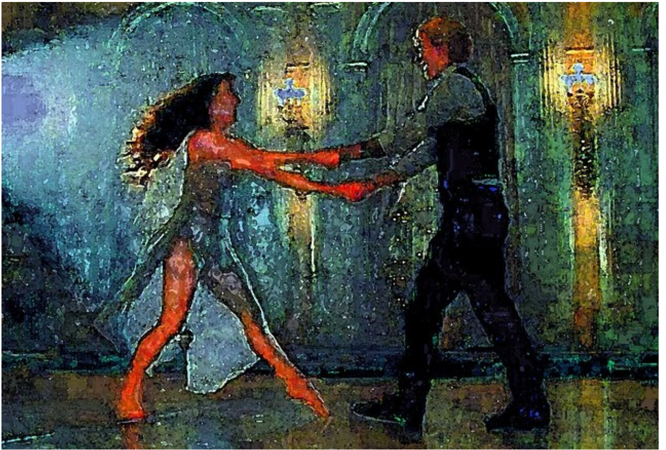
Country Line Dance